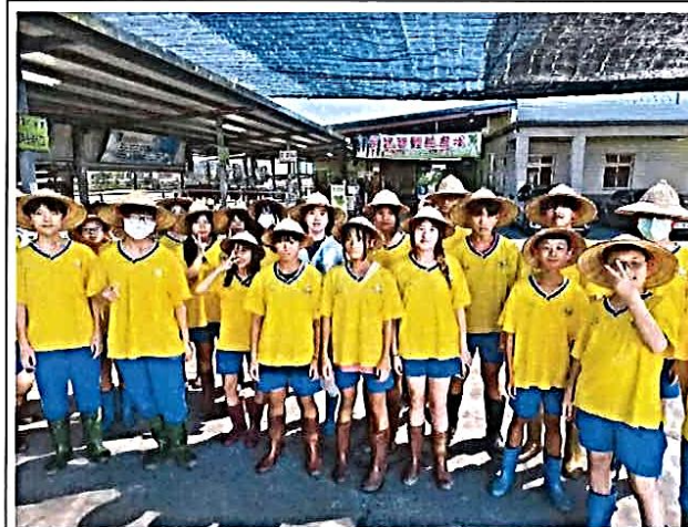
說明：小小蔥農一下田採蔥標準裝備