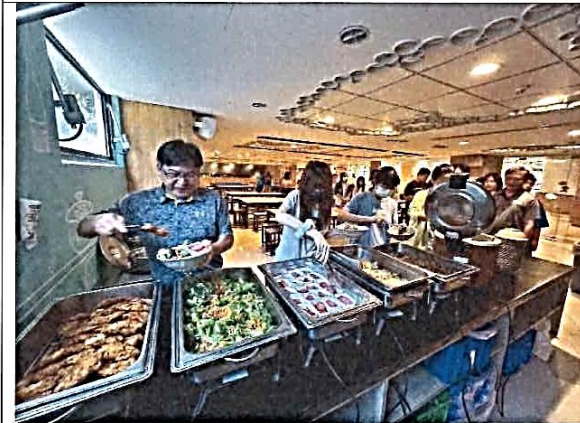
說明：午餐享用美味自助餐。