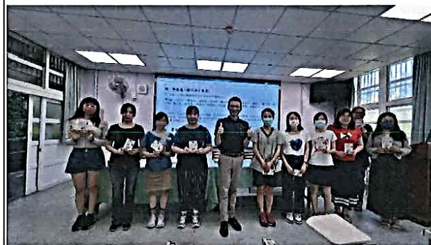
說明：發放投稿綠色學校教材教具