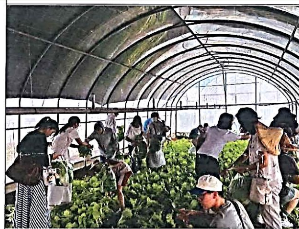
說明：到農園溫室採小白菜體驗