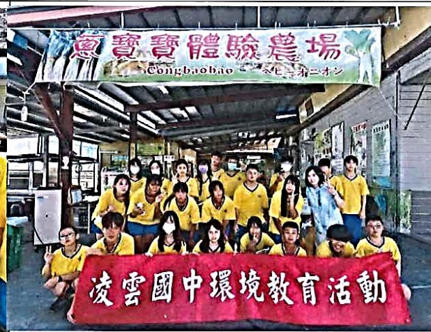
說明：食農與環境教育的具體實踐面