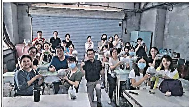
說明：環教生態研習——生態瓶製作