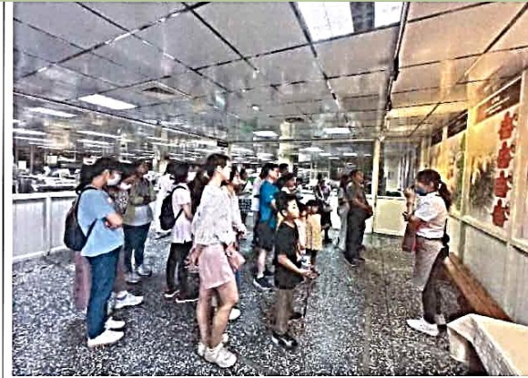
說明：114 年 8 月 25 日郭元益糕餅博物館研習，上午大家聆聽館方人員的導覽。