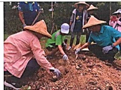
說明：實地操作控窯