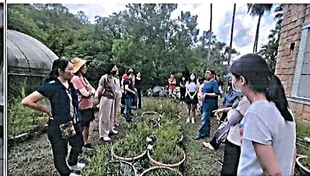
說明：環教生態研習——水生植物參觀