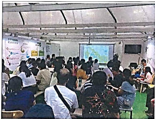
說明：導覽人員進行台塑農場週邊導覽

114 年度推展「教育部綠色學校夥伴網路」獎勵計畫 —績優學校（中平國小）環境教育執行成果報告