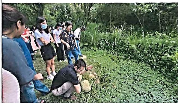
說明：環教生態研習——埤塘參觀