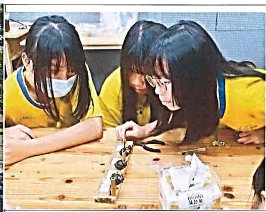
說明：專注學習手作課-貓頭鷹精油鑰匙圈