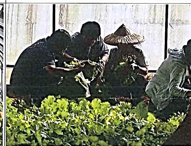
說明：採菜後將根部修剪後集中堆肥處理