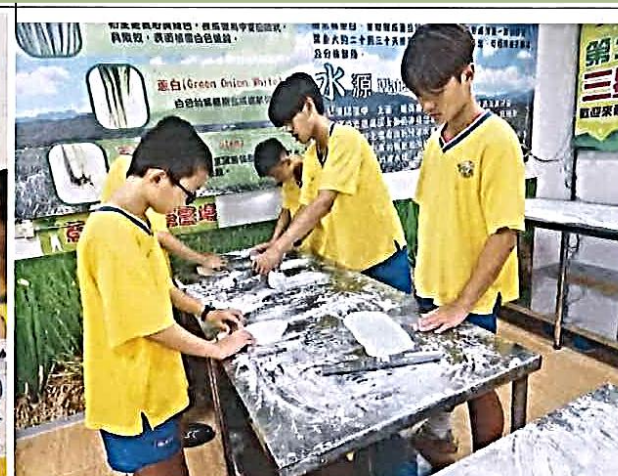
說明：食在地宜蘭三星鄉-蔥油餅親手做