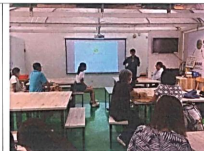
說明：導覽生態環境教育