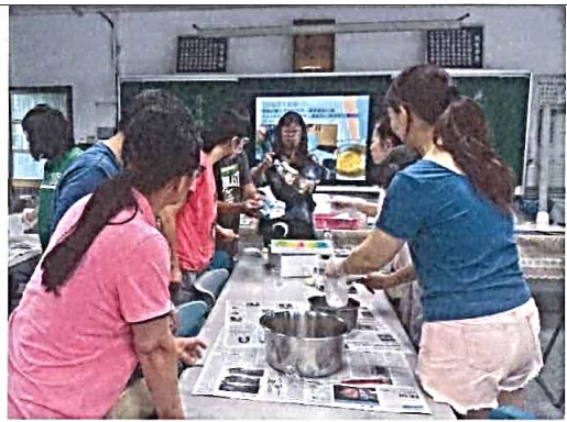
說明：學校老師在高主任指導下進行手工皂製作。