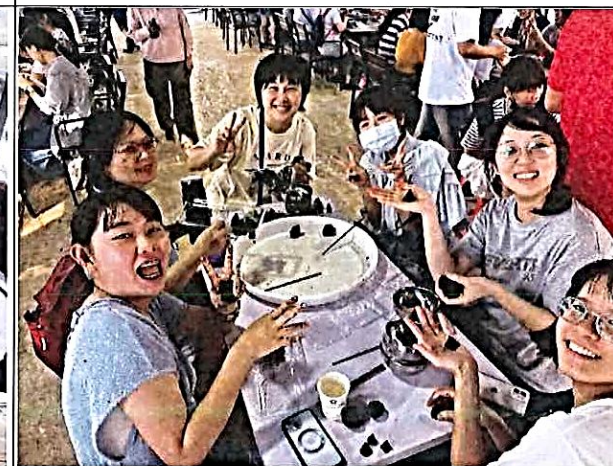
說明：將搗好的艾草塑型並在底部戳洞