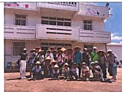
說明：台塑生態農場大合照