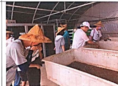
說明：廚餘好夥伴-黑水虻養殖