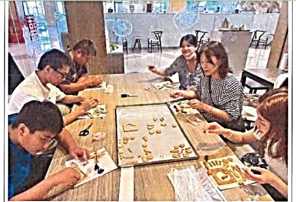
說明：大家製作埤塘手工餅乾，先壓模，再烘烤，最後進行組裝與彩繪。