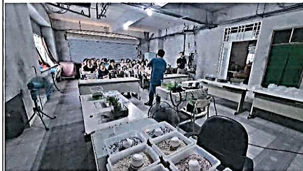
說明：環教生態研習——生態講習