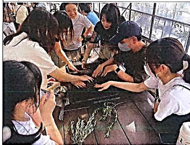
說明：進行艾草香椎 DIY 體驗