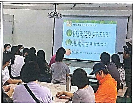
說明：導覽人員說明農場內種植蔬菜