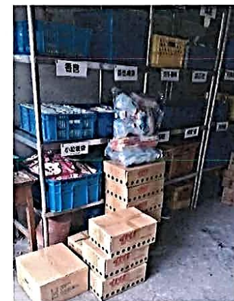
說明：添購打掃用具