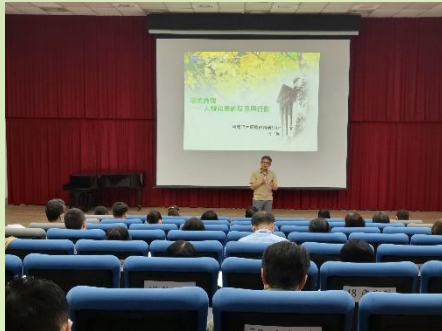
張子超教授講述「環境倫理」及「循環經濟與綠色消費」議題