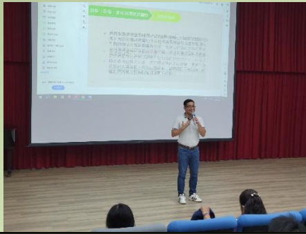
陶藝文校長開場致詞