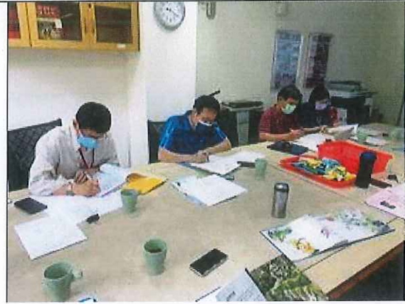
食農教育申請案審查會議