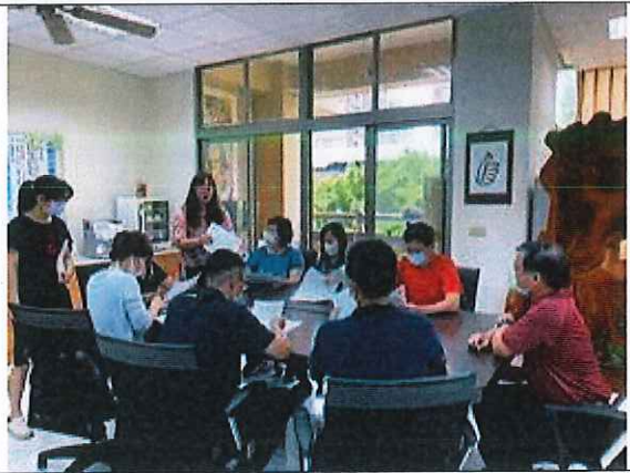
濕地教育申請案審查會議