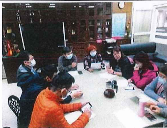
召開期初會議、討論本學期行事及工作會報