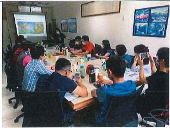
環境教育繪本編審會議