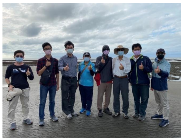
參與外埠踏查學員在觀新藻礁大合照