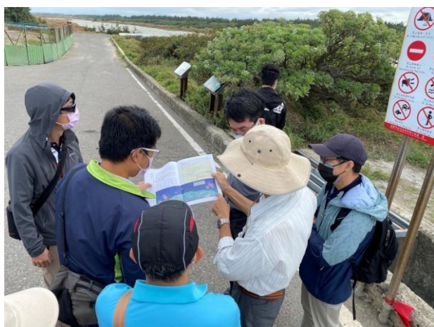
說明：許0陽教授帶學員概覽許厝港