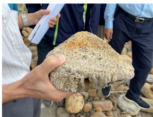
說明：認識珊瑚礁與藻礁的異同