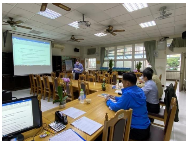
說明：董校長為三位評委說明評選依據及評分標準